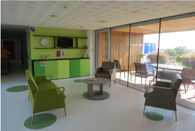
Les petits salons

Vous avez la possibilité d'apporter votre télévision qui sera installée dans votre chambre. Par ailleurs plusieurs postes de télévisions sont installés dans les différents salons de l'établissement.