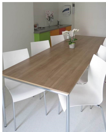
La salle à manger des familles

Les visites sont autorisées 7 jours sur 7 de 13h30 à 20h00.