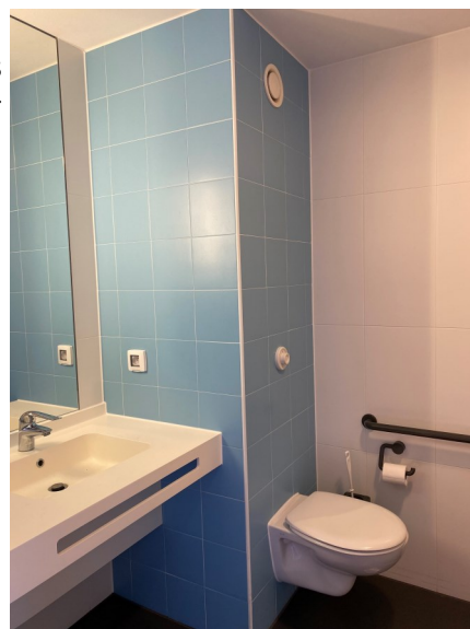
La salle de bain